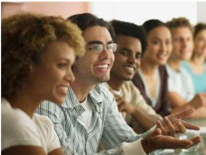
Europa: un mercado de ideas.

La revolución tecnológica en curso está transformando radicalmente la vida en el mundo industrializado en el que se encuentra Europa. Lo fundamental es comprender que esto plantea nuevos retos que trascienden las fronteras tradicionales. El desarrollo sostenible, el equilibrio demográfico, el dinamismo de la economía, la solidaridad social o las respuestas éticas ante los avances de las ciencias de la vida son cuestiones que ya no pueden abordarse eficazmente a escala nacional. Asimismo, debemos mirar a las futuras generaciones.