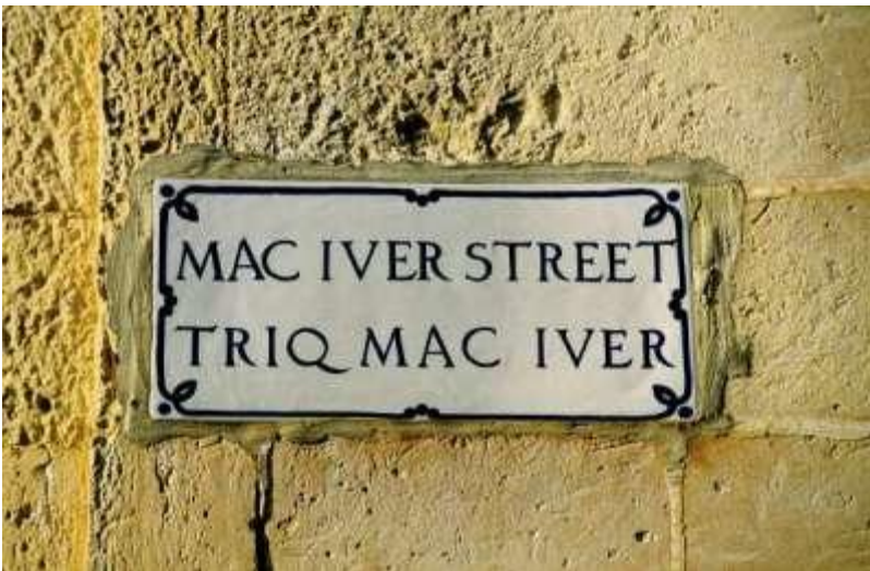
"Unida en la diversidad". Placa bilingüe de una calle en Malta.

Pero esto no debe hacerse, y no se ha hecho, a costa de comprometer la riqueza cultural o lingüística de los países de la UE. Al contrario, son muchas las actividades de la UE que ayudan a generar un crecimiento económico basado en las características regionales y en la rica diversidad de tradiciones y culturas.