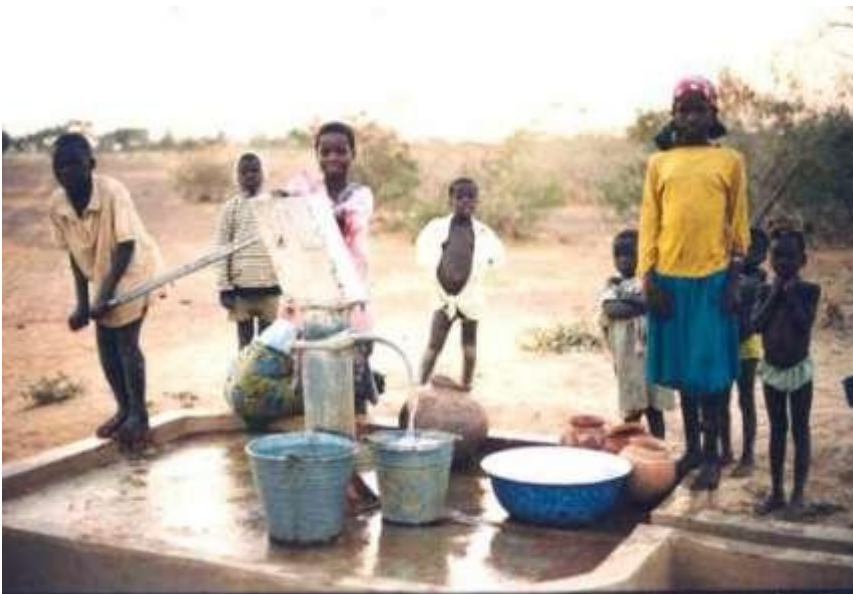
Una de las prioridades de la UE es garantizar el acceso universal al agua limpia.

La relación entre Europa y el África subsahariana es antigua, ya que data de la concepción misma del Tratado de Roma en 1957, que convertía en asociados a los países y territorios de ultramar de determinados Estados miembros. El proceso de descolonización iniciado al comienzo de los años sesenta transformó dicho vínculo en una asociación de carácter diferente entre países soberanos.